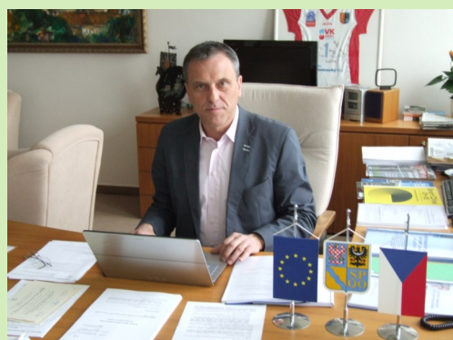
- Váš Jiří Rozbořil, hejtman Olomouckého kraje -

Ať již patříte do kterékoliv skupiny, chci Vám všem v těchto krásných jarních dnech popřát příjemné, klidné a spokojené prožití Velikonocních svátků naplněných vzájemným porozuměním a tolerancí.